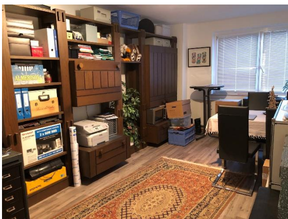
Schlafen oder Büro