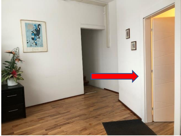
Hausflur, Eingang Wohnung