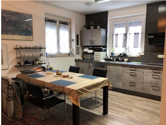
Küche u. Essen