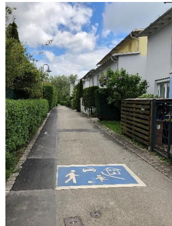
Zugangsweg zum Haus