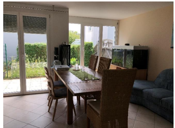
EG Wohnen, Zugang Terrasse Süden