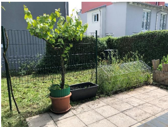
Terrasse und Gärtle, Süden