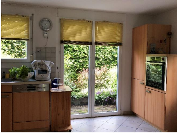
Küche, Zugang kleine Terrasse