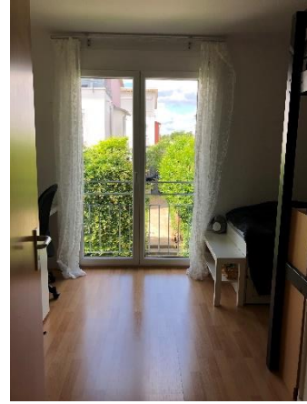
1.OG Schlafen 1