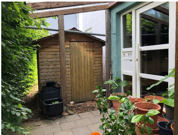
Haus Eingang, überdacht