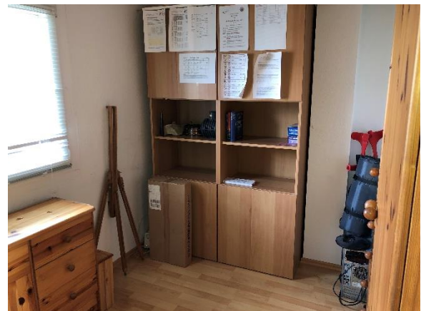
2.OG Büro oder Abstellraum