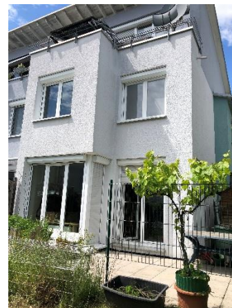
Haus Rückseite, Süden