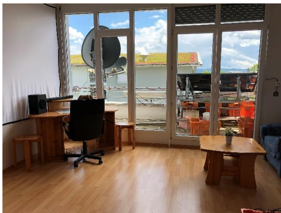
2. OG Studio mit Dachterrasse