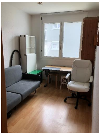
1.OG Schlafen 2