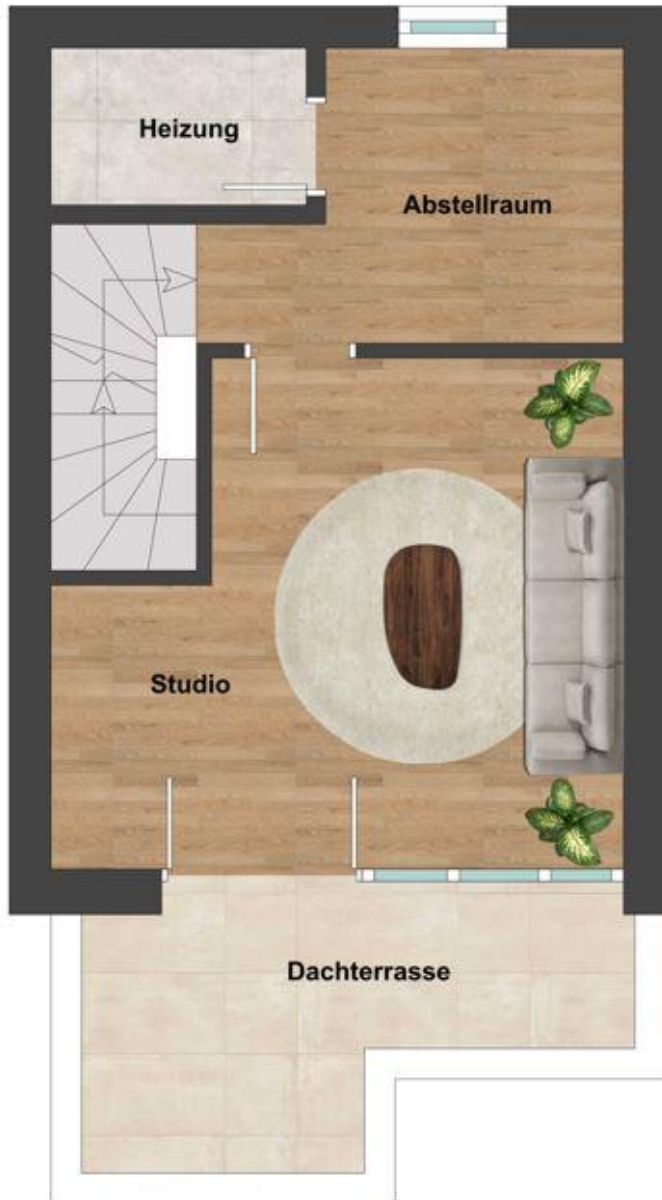
Grundriss 2. OG (nicht maßstabsgetreu, nur zur ungefähren Ansicht)